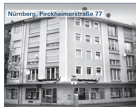
Nürnberg, Pirckheimerstraße 77