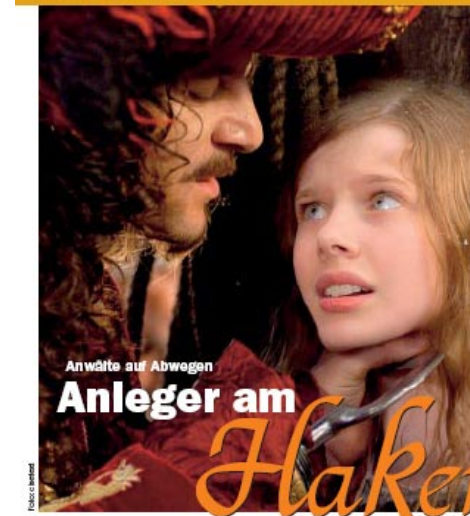
Anleger am Haken